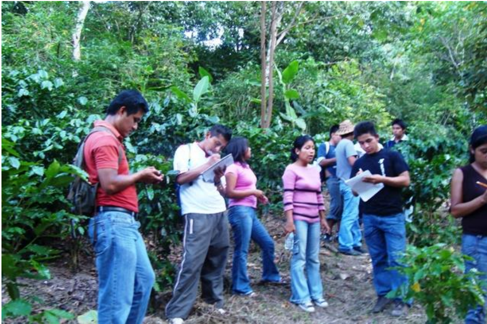
Evaluación de parcelas por alumnos de la UIEP (promotores del proyecto)