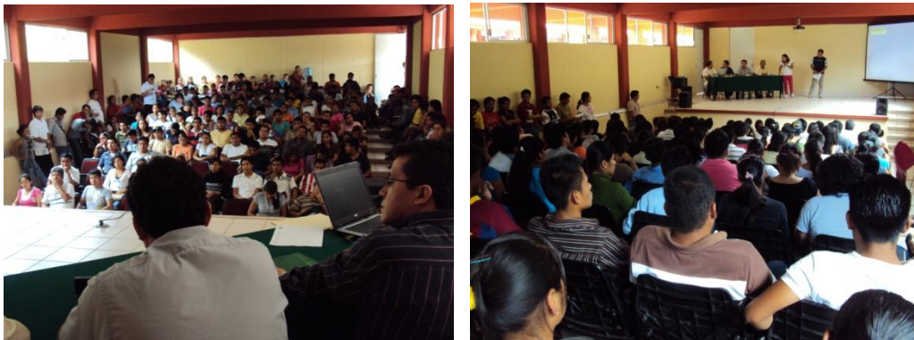
Presentación en el auditorio de las experiencias de Vinculación