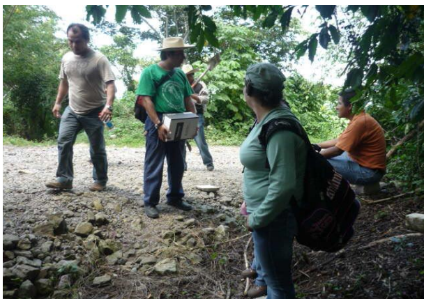
Profesores participantes en el curso