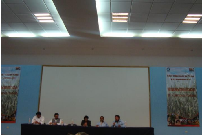
Presentación en plenaria con los ponentes