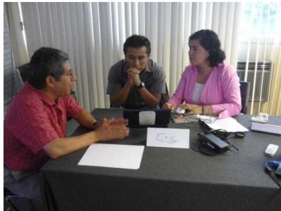
Presentación de trabajos de tesis y asesoría individualizada con cada egresado